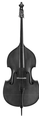
Photo : Jean-Marc Anglès. Musée de la musique – Philharmonie de Paris.

La batterie est un ensemble d'instruments à percussion utilisés pour marquer le rythme. La grosse caisse (1) est jouée avec la pédale par le pied droit. La caisse claire (2) est jouée avec des baguettes. Elle a un timbre métallique, dû aux fils de métal plaqués sous la peau. Les toms (3), souvent au nombre de trois de tailles différentes, produisent des sons de hauteurs variées. Les cymbales (4) sont de plusieurs sortes : la Charleston, double, s'actionne avec une pédale. La crash et la ride sont frappées par des baguettes.